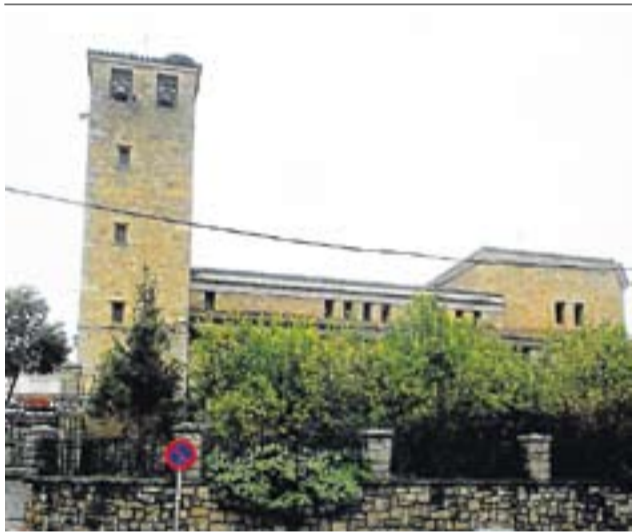
Un templo registrado en Extremadura. MIGUEL G. CASTRO

nuncia y la retirada del sacerdote que impartió misa durante 30 años por la disputa de unos terrenos: o la misa o la propiedad. En la mayoría de los casos, el Registro de la Propiedad ha permitido a la Iglesia beneficiarse del trabajo, el esfuerzo y la inversión de los vecinos durante muchos años, que ahora califica de "donativos".