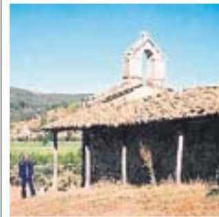
La ermita de Pardesivil.