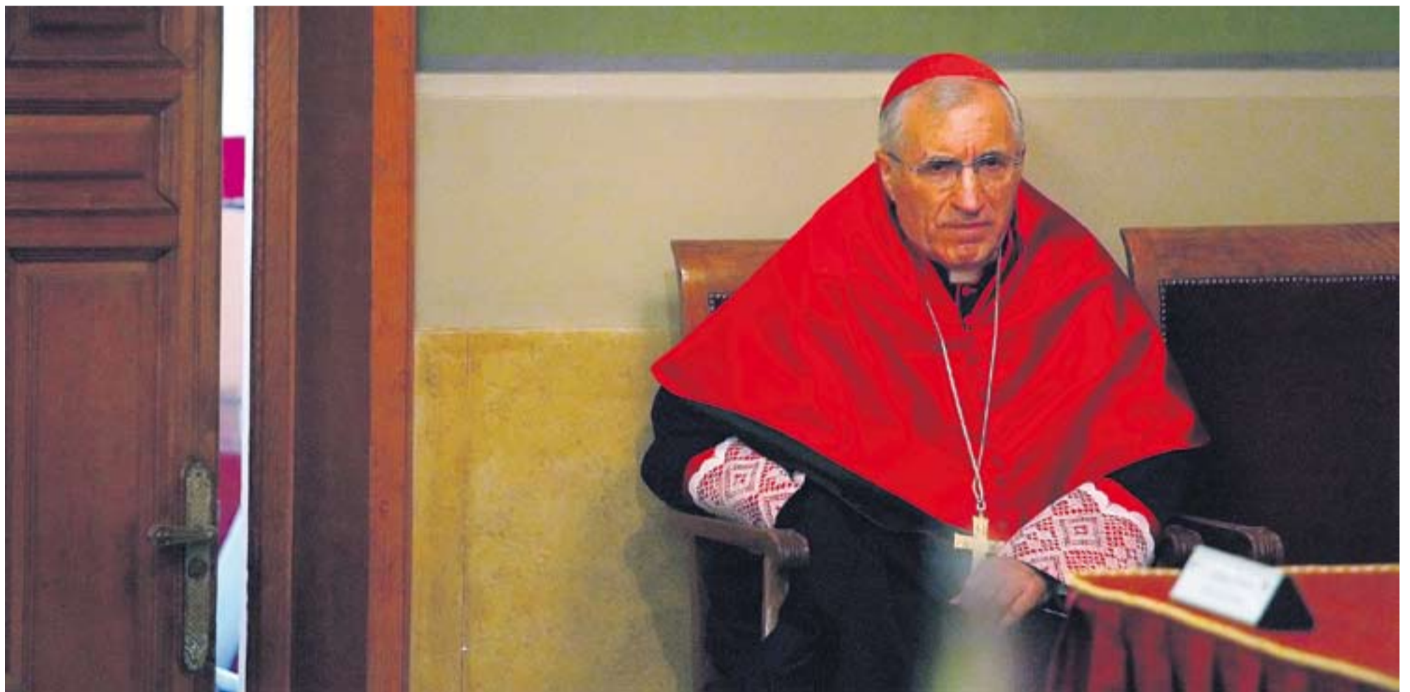
El presidente de la Conferencia Episcopal Española, Antonio María Rouco Varela, es la cabeza visible de la jerarquía eclesiástica en España. JON BARANDICA

con los principios constitucionales de laicidad del Estado y de igualdad. Pero desde los Acuerdos Iglesia-Estado de 1979, esta situación ha permanecido inamovible. Así, sólo se permite la exención del impuesto a las cuatro confesiones (católica, musulmana, evangélica y judía) que suscribieron dicho tratado. El resto de religiones tributa por todos sus edificios y propiedades inmuebles.