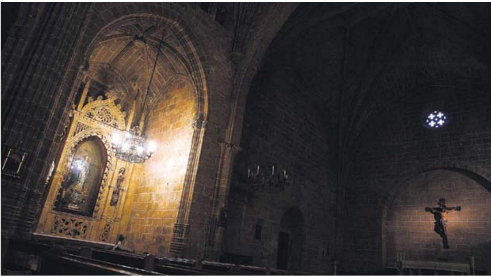
La iglesia fortaleza de San Bartolomé se erigió en el siglo XIV por orden de Jaime II para defender Xàbia.