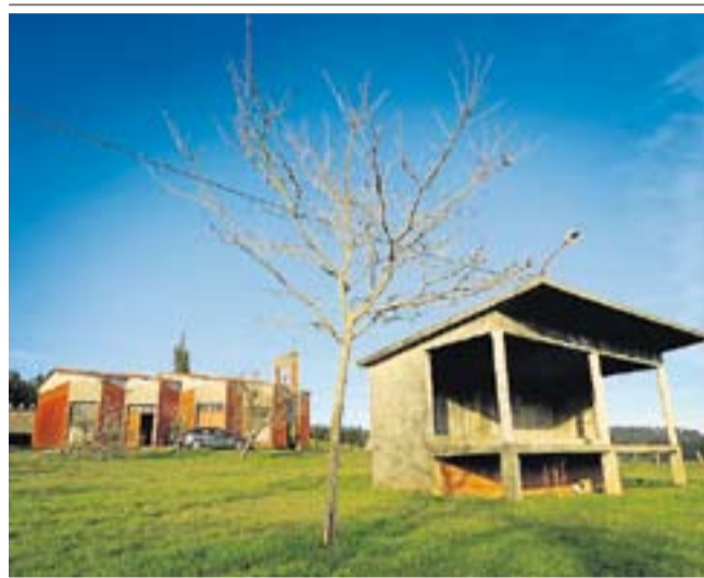
El obispado amenazó al pueblo con no dar misa. M. RIOPA

En algunas localidades, ha llegado a inscribir prácticamente toda la plaza que rodea a los templos. En Aldeanueva, incluso la casa parroquial. En Pasarón, los vecinos recogieron firmas pero fue el propio párroco de la localidad quien amainó la protesta al amenazar con la excomunión a los fieles. *